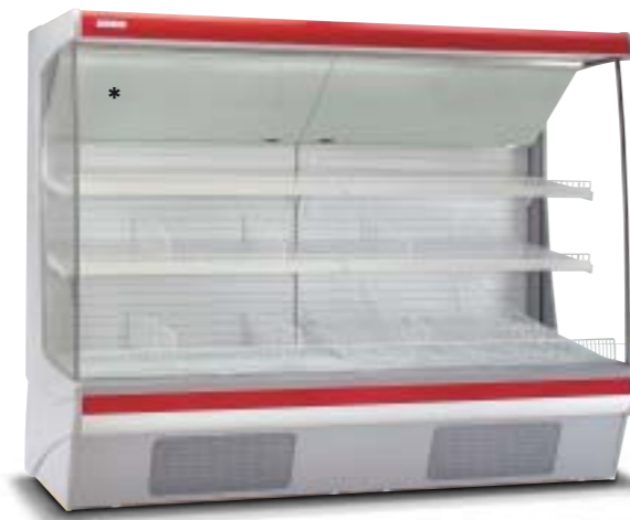
Disponibile versione 3M1. Version 3M1 (meat) available.